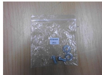
1 Set mit Schrauben